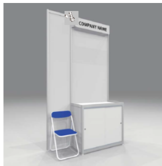
※画像はイメージです。備品の色合い等が一部変更となる可能性があります。