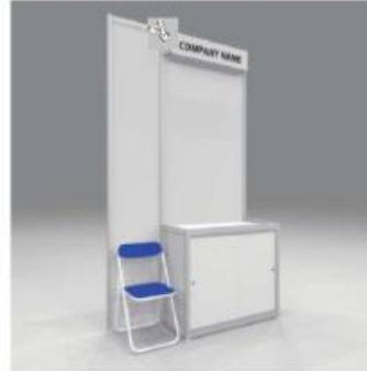
※画像はイメージです。備品の色合い等が一部変更となる可能性があります。